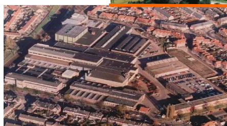
SMIT Transformatoren B.V.; Ньюмеген

Starkstrom-Gerätebau GmbH Ohmstraße 10 D-93055 Regensburg