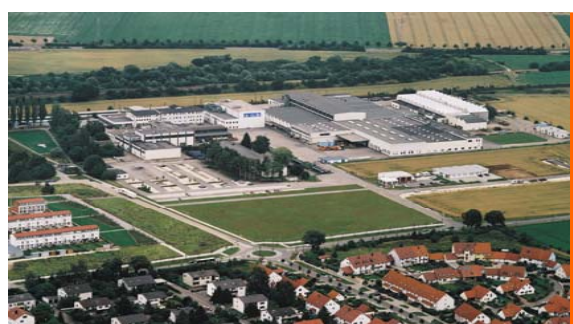
Starkstrom-Gerätebau GmbH; Регенсбург